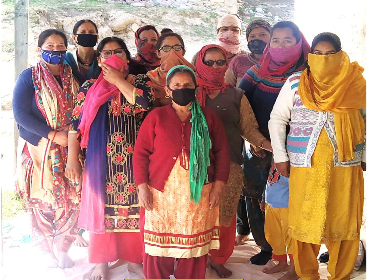
गौरी समूह के सदस्य